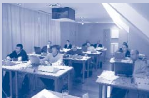
Sala corsi Vantage EMEA

N.B. Per eventuali informazioni in relazione ai corsi, e per ricevere il modulo di iscrizione, potete telefonare al numero 049/9403000 (Sig. Nicola Agostini), o inviare una e-mail al seguente indirizzo info@vantageitalia.it