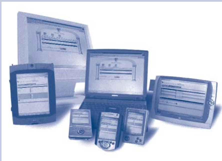
Il WebPoint™ permette il controllo centrale e la programmazione da un PDA, Webpad o PC. La versione base è gratuita.

http://www.vantagecontrols.com/webpoint/webpointinst.html