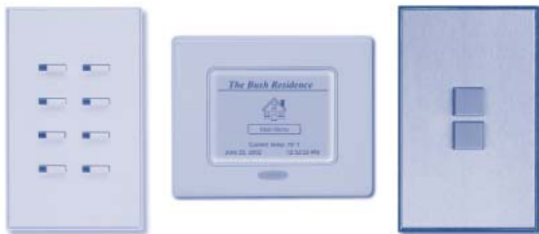
Le tastiere sono disponibili in diversi modelli e colori.

A qualsiasi desiderio del proprietario, qualsiasi progetto dell'architetto, Vantage offre un illimitato numero di facilitazioni e controlli. L'intero sistema lavora tramite schermi tattili, tastiere intelligenti, timers, sensori di movimento, può comunque essere centralmente controllato attraverso orologi astronomici, i quali sono componenti standard del sistema. Il controllo è anche possibile con l'uso di un telecomando o di un telefono. Grazie al "WEB POINT" il controllo può essere effettuato tramite qualsivoglia tipologia di dispositivo WEB anche in via remota "come sarà specificato in altre parti di questa comunicazione".