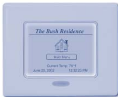
LCD320 è disponibile in diversi colori

esigenze di gran parte delle applicazioni. L'LCD monocromatico ha una risoluzione di un _ di VGA. Non appena una persona si avvicina, un sensore di prossimità percepisce il movimento ed accende il dispositivo del display. La grafica di alta risoluzione appare e l'utente può navigare tra 255 pagine distinte per controllare ogni compo-