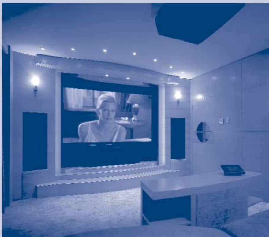
Theatrepoint™ integra facilmente qualsiasi cosa in un home theatre

Con un tale dotazione di strumenti il TheatrePoint™ integra facilmente qualsiasi cosa, dai video, ai motori, alle aperture delle finestre, tutte le attrezzature audio/video come proiettori, ricevitori, radio e DVD. Lega velocemente e facilmente nel controllo dell'illuminazione, il sistema di sicurezza è persino schermi tattili di altre aziende. Combinato con il RadioLink C-Box della Vantage, il TheatrePoint™ non solo provvede al controllo completo dell'home theatre, ma in radiofrequenza integra questo controllo a tutta l'illuminazione, HVAC e altri sottosistemi della casa.